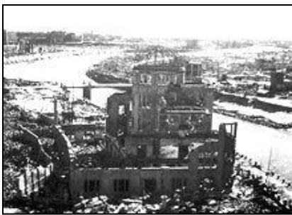
<資料映像：原爆ドーム>

今回の平和学習において、風化してはならない「反戦の思い」を、後生へつないでいく気持ちが芽生えることを期待しています。