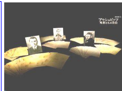
<資料映像：アウシュビッツ 死者たちの告白 NHK>