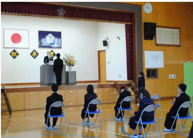
そつぎょうしょうしよじゅよしき 卒業証書授与式

そつぎょうしょうしよじゅよしき なかいずみしょうだいこ えんそう とお ねんかん しゅうたいせい きょうじ 「卒業証書授与式」、そして「中泉小太鼓」の演奏を通して、6年間の集大成である行事 を見事にやり上げた11名（男子5名・女子 めい ねんせい しょうらい ゆめ じつげん きぼう 6名）の6年生。将来の夢の実現と希望の 未来に向かってせいちょう していくことを願って やみません。