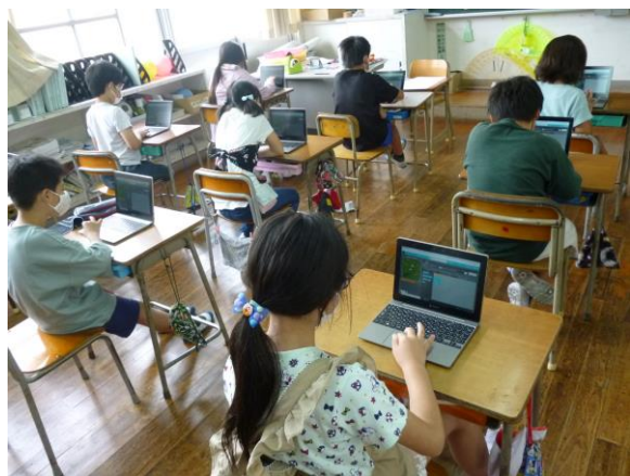
4年生「プログラミングの学習」 マイクラフトというソフトを使う子どもたち。

タブレットをツール(道具)として使いこなしていくことはまだまだできていませんが、“習うより慣れろ”の精神で、まずはいろいろ使っていくながら学習を進めています。