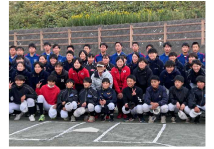
ソフトボール教室