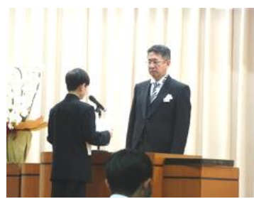
新入生誓いの言葉