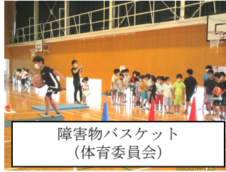
障害物バスケット (体育委員会)