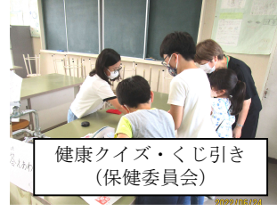
健康クイズ・くじ引き (保健委員会)

5,6年生は、低学年の人に、分かりやすくルールを説明するなど、高学年として立派な姿を見せていました。