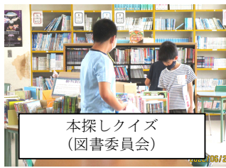
本探しクイズ (図書委員会)