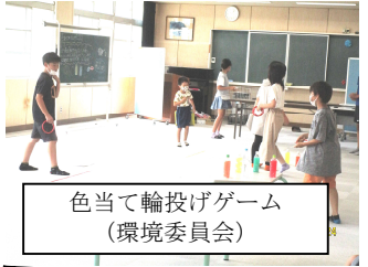
色当て輪投げゲーム (環境委員会)