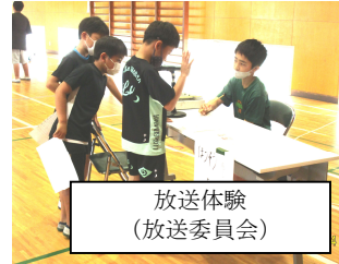
放送体験 (放送委員会)