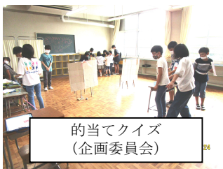
的当てクイズ (企画委員会)