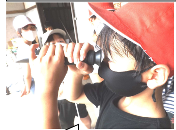
のぞいてみよう!糖度計