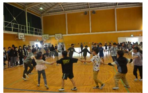
【ゲームを楽しむ子どもたち】