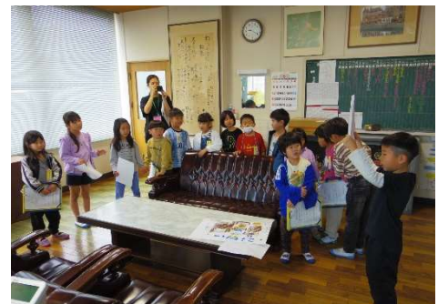
【校長室を説明する2年生】

5月8日(水)に、生活科の時間として、1年生と2年生の学校探検を行いました。この学習は、毎年実施しており、2年生が植木小学校内のいろいろな場所のことを1年生に伝える活動です。2年生は、伝える場所を分担して、事前に取材に行き、何をどのように伝えると1年生が楽しく、わかりやすく伝わるかを考えて活動していました。学校探検当日は、2年生に手を引かれた1年生が、学校の色々な場所を探検しました。その際、1年生が楽しく学べるように、説明をクイズ形式にしたり探検した場所のスタンプを押したりするなどの工夫がたくさんありました。1年生が笑顔で探検している姿と2年生がお世話をしながら一生懸命に説明している姿がとても印象的でした。