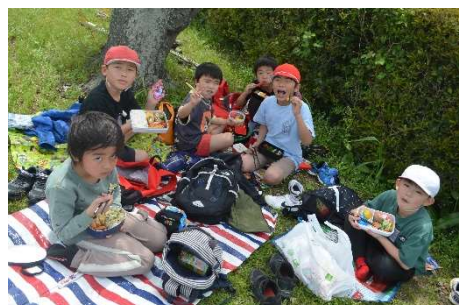
【歓迎遠足の昼食の様子】

1年生は6年生に手を引かれ、他の学年もしっかりとした足どりで、植木桜づつみ公園まで歩くことができました。外で食べるお弁当は格別で、友達とのおしゃべりも弾んでいました。