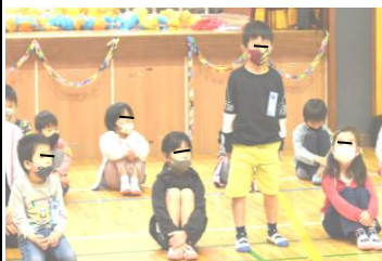
自己紹介をする1年生